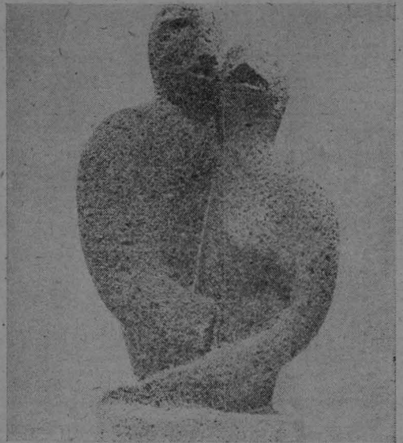
"Pareja", grupo escultórico de la artista mexicana, Geles Cabrera, una de las obras expuestas por esta escultora en la ciudad de Washington.